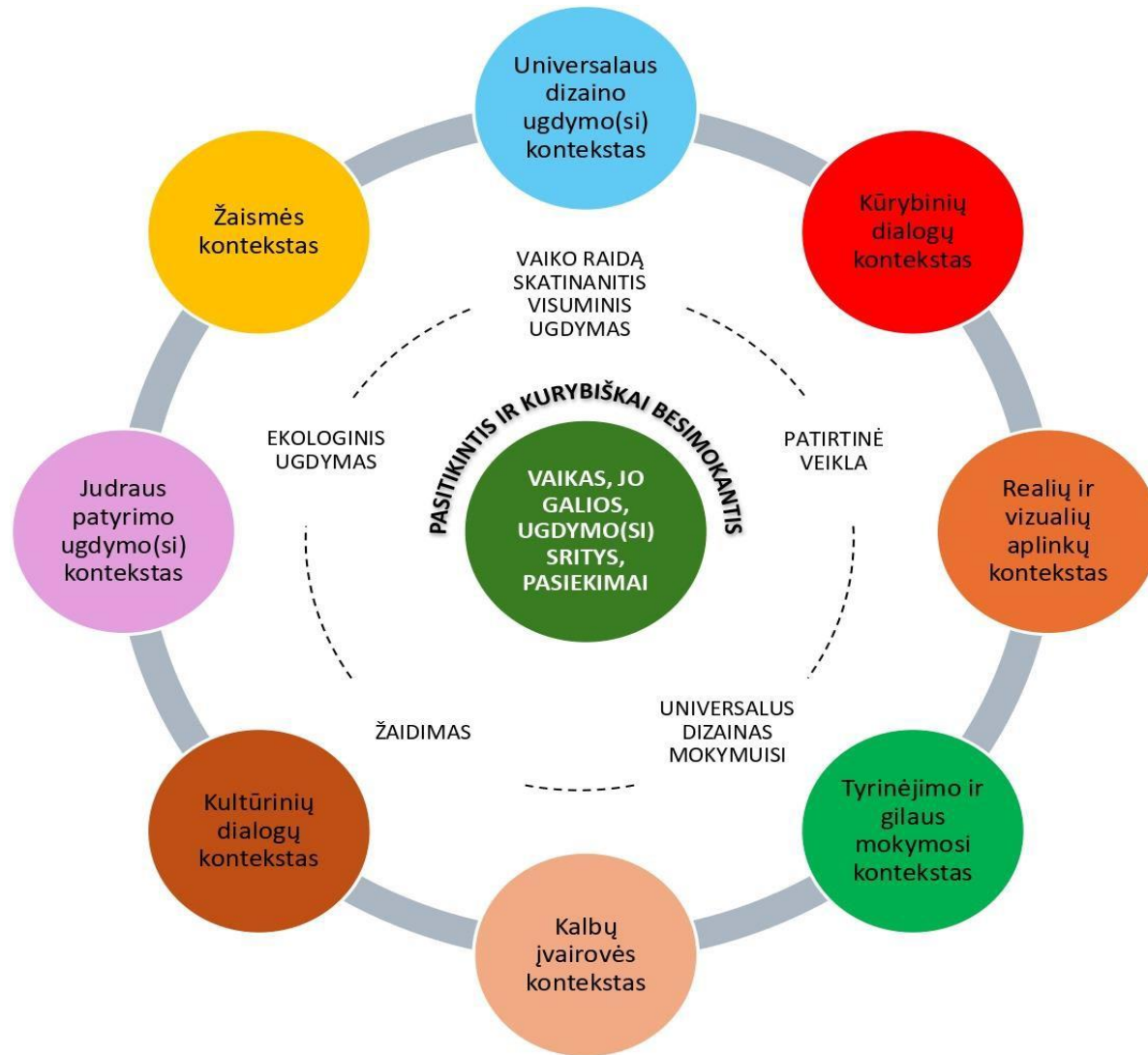
12.6.1. schema. Joniškio r. pagrindinės mokyklos ikimokyklinio ugdymo programos konceptualus ugdymo modelis